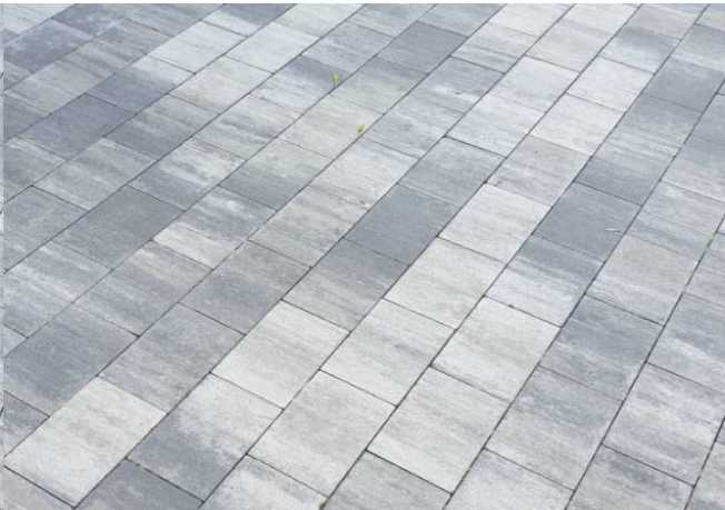
WZÓR KOSTKI BRUKOWEJ BETONOWEJ BEZFAZOWEJ

Schody z betonu architektonicznego to funkcjonalne i estetyczne rozwiązanie dla wymagających. Stopnie betonowe są starannie i solidnie wykonane z wysokiej jakości materiałów, gwarantując ich bezpieczeństwo, trwałość i odporność na warunki atmosferyczne oraz wytrzymałość w eksploatacji.