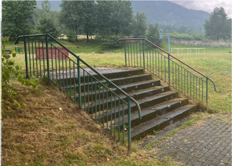
ISTNIEJACE SCHODY ZEWNĘTRZNE DO REMONTU NR 1

Zakres prac remontowych obejmuje wymianę stopni schodowych (rozbiórka istniejących stopni betonowych, ułożenie stopnic prefabrykowanych betonowych, szerokość stopnia min. 35 cm, wysokość stopnia max 15 cm). Stopnice ułożyć na ławie betonowej i podbudowie kamiennej (wg technologii utwardzeń chodników).